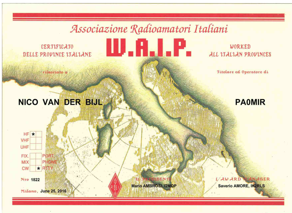
Award 1: Het Italiaanse WAIP award, zie pagina 5.

PiebeJan van den Berg - PE1LZS / DIG 5026